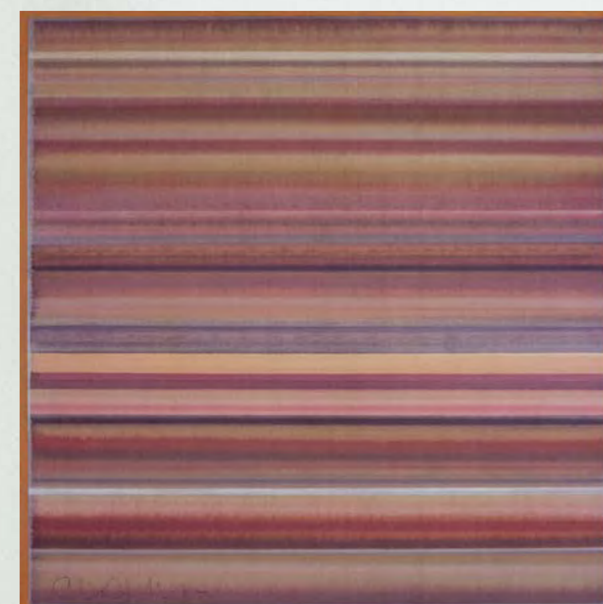
GUILLERMO WIEDEMANN Sin título 1963 collage

A partir de 1960 y durante las dos décadas siguientes, la abstracción se afianzó como la representación del arte contemporáneo del país. Sus nuevos exponentes hicieron propuestas más complejas, planteando además preguntas sobre el proceso mismo de hacer arte. Al respecto, el artista Carlos Rojas afirmaba: “nunca he creado nada [...]”. Al interior de lo que estudio, analizo y comparo, salen unos denominadores comunes que al ser aglomerados dan un resultado y esa es la obra. Para que fuera creación tendría que salir de la nada y lo mío es producto de una serie de cosas cuyo resumen se llama cuadro”.