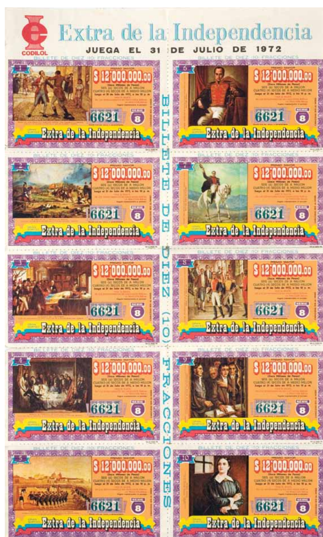
Galas de Colombia Ltda. Impresores • 1972 • Impreso sobre papel • Colección privada

Los medios de reproducción como el grabado, permitieron la difusión durante el siglo XIX de retratos de algunos protagonistas y acontecimientos de la Independencia. Posteriormente, la popularización de estas representaciones se produjo a través de la prensa ilustrada, ediciones de estampillas, billetes, textos escolares y publicidad.