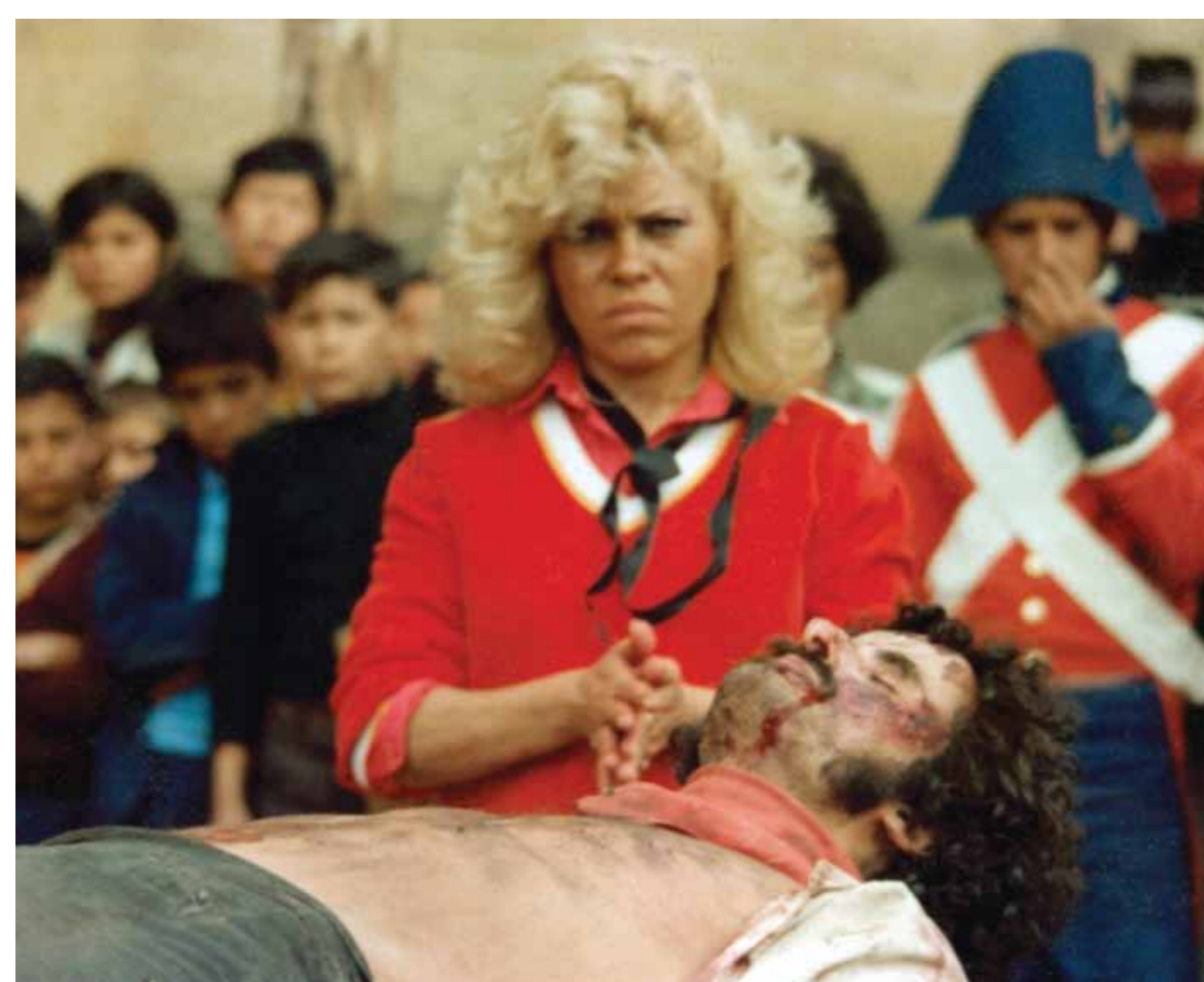
Bolívar soy yo • Carlos Duque • 2002 • Impreso • CMO Producciones, Bogotá

La televisión permitió visibilizar parcialmente diversos actores sociales. Mediante locaciones, escenografía, vestuario, utilería y elementos de ficción, se buscó presentar los hechos de manera convincente, basados en la investigación histórica. Las miniseries Revivamos nuestra historia y Crónicas de una generación trágica tuvieron fines educativos, culturales y de entretenimiento que buscaron familiarizar a los espectadores con la historia. Entre las telenovelas se destacaron Alondra (1964) sobre la vida de la Pola, Manuelita Sáenz (1978) y luego La Pola (2010).